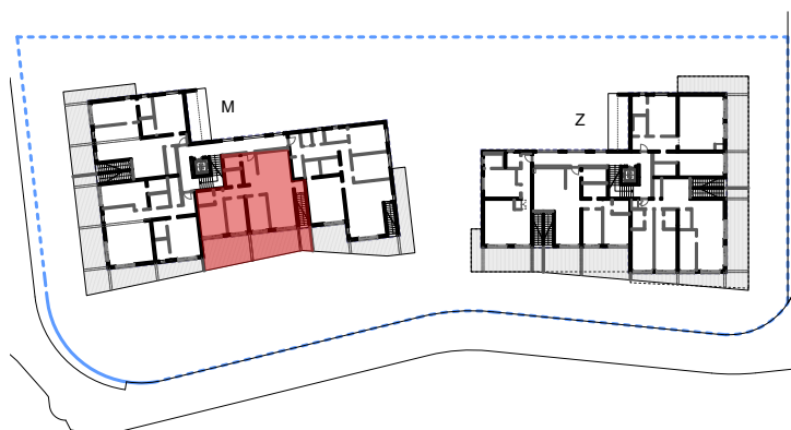
3. KAT - STAN M-303